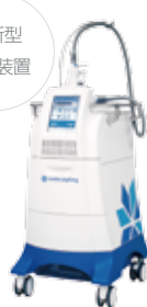
冷却療法用装置 ゼルティック 医療機器製造販売承認番号 223AFBZX00113000